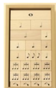
表と裏は違う音符